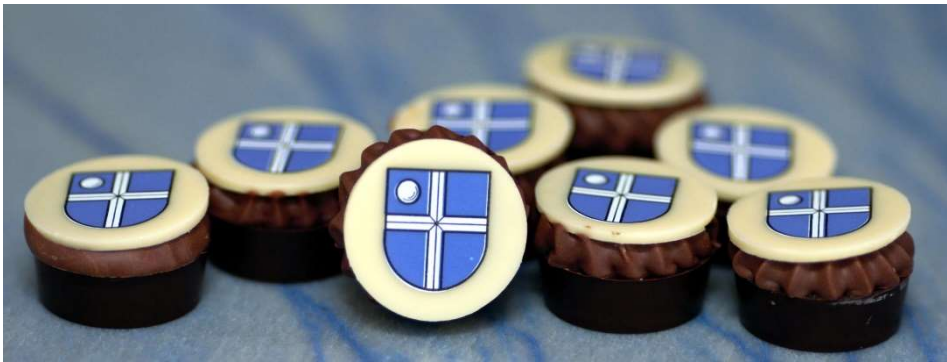
Bruchsaler-Wappenpraline 2021 auf Azul do Macaubas. Anm. Herr Spiegel, Fa. Stadelwieser GbR, Heidelberg."... dem teuersten Werkstein der Welt..."

„Man muss dem Körper Gutes tun, damit die Seele Lust hat, darin zu wohnen.“