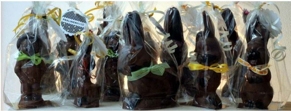
Hasenfamilie aus Grand Cru Schokoladen und andere Leckereien zu Ostern.

...Hasen werden zu Ostern verschenkt, weil der Wildhase in der byzantinischen Tradition ein Symbol der Auferstehung ist.